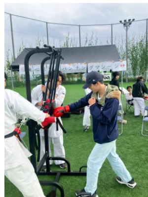
第78回九大祭の様子